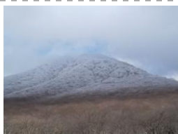
4월 한라산 적설(4.7)